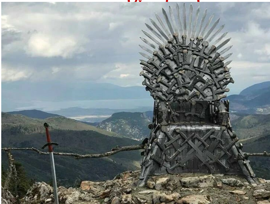
"Θρόνος του Δία" με θέα την Παυλιανή . Δημόσιο Κτήμα

Το παραδοσιακό ορεινό χωριό Παυλιανή , σκαρφαλωμένο ψηλά στις πλαγιές του όρους Οίτη στην κεντρική Ελλάδα , έχει εξελιχθεί σε έναν δημοφιλή τουριστικό προορισμό, συνδυάζοντας επιδέξια την πλούσια ιστορία και την παρθένα φυσική ομορφιά με ένα μοναδικό, ιδιόμορφο πνεύμα διακοπών.