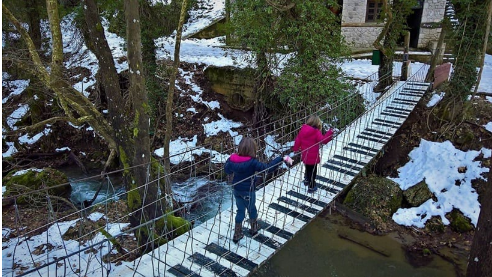
Музыкальный мост в Павлиани. Общественное достояние