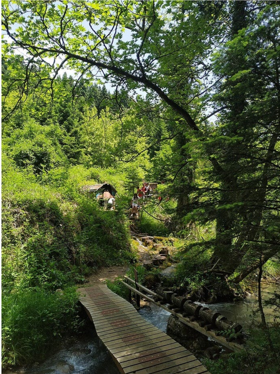
Ворота в национальный парк Оэта

Помимо парка отдыха, Павлиани служит главным входом в национальный парк Оэта, одну из важнейших охраняемых территорий Греции. Окружающий ландшафт характеризуется густыми еловыми лесами ( Abies cephalonica ), каштановыми рощами и обилием водных источников.