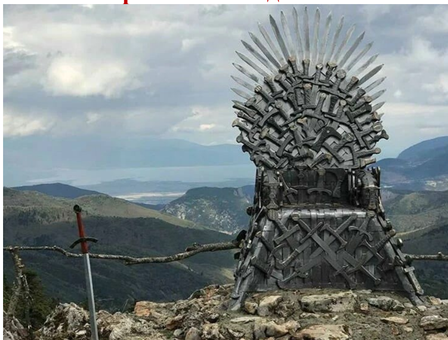
«Трон Зевса» с видом на Павлиани.

Традиционная горная деревня Павльяни, расположенная высоко на склонах горы Оэта (Оити) в центральной части Греции, превратилась в популярное туристическое направление, умело сочетающее богатую историю и первозданную природную красоту с уникальным, причудливым духом отдыха.